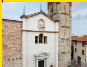
4 COLLEGIATA DI SANTO STEFANO Vimercate