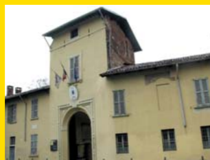
2 PALAZZO TROTTI Vimercate