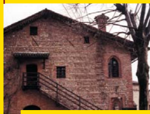
6 CASINÒ DI CACCIA BORROMEO Oreno di Vimercate