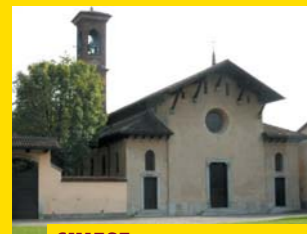
11 CHIESE E ORATORI Concorezzo

Il territorio della Brianza orientale, tra Vimercate e l'Adda, conserva tuttora valori e caratteri paesaggistici e naturali quasi completamente scomparsi nel Nord-Milano: una campagna lievemente ondulata nella quale si sono preservate alcune notevoli tracce della storia.