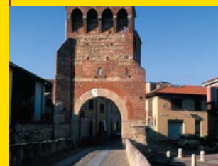
3 PONTE DI SAN ROCCO Vimercate