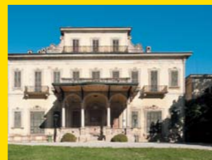
8 VILLA BORROMEO D'ADDA Arcore