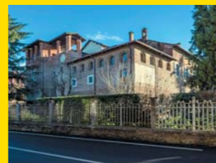
13 CASTELLO LAMPUGNANI Sulbiate