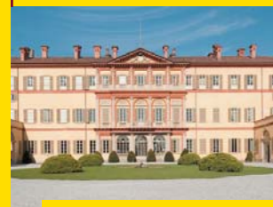
5 VILLA GALLARATI SCOTTI Oreno di Vimercate