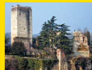
14 CASTELLO VISCONTEO Trezzo sull'Adda